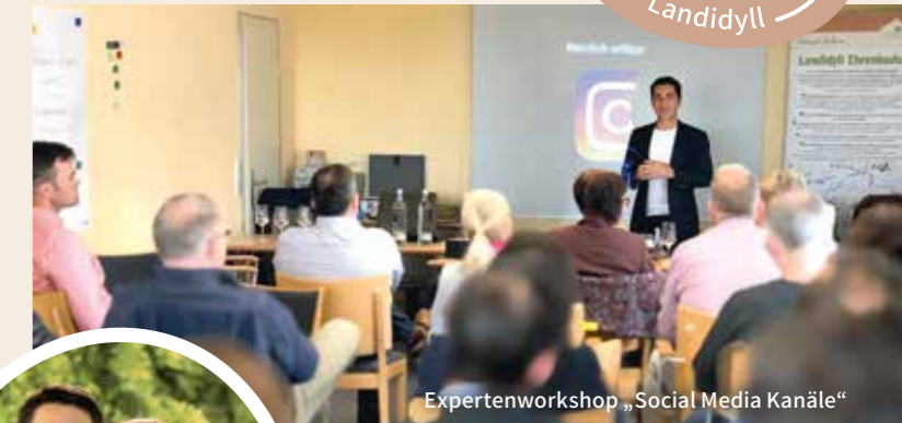
Expertenworkshop „Social Media Kanäle“